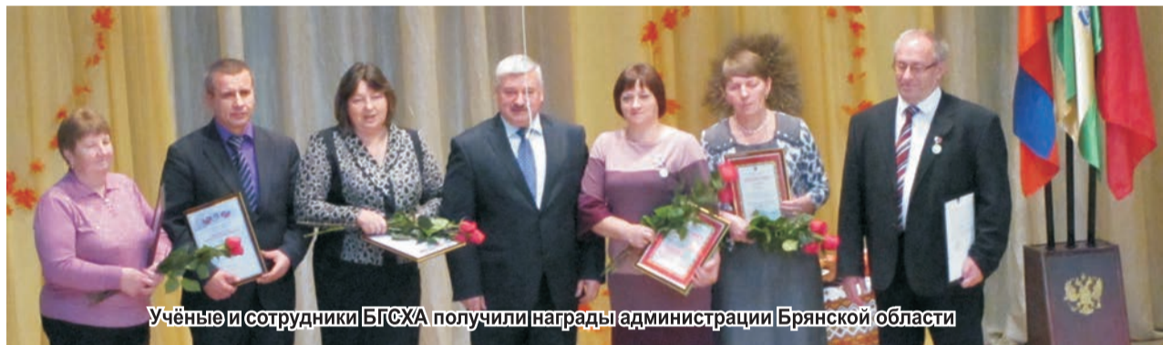
Учёные и сотрудники БГСХА получили награды администрации Брянской области

Каждое поздравление сопровождалось номерами художественной самодеятельности, подготовленные культурно-досуговым центром БГСХА. Ну и конечно же не обошлось без выступления известного не только в Кокшино, но и далеко за его пределами ансамбля «Бабкины внуки», которому руко-