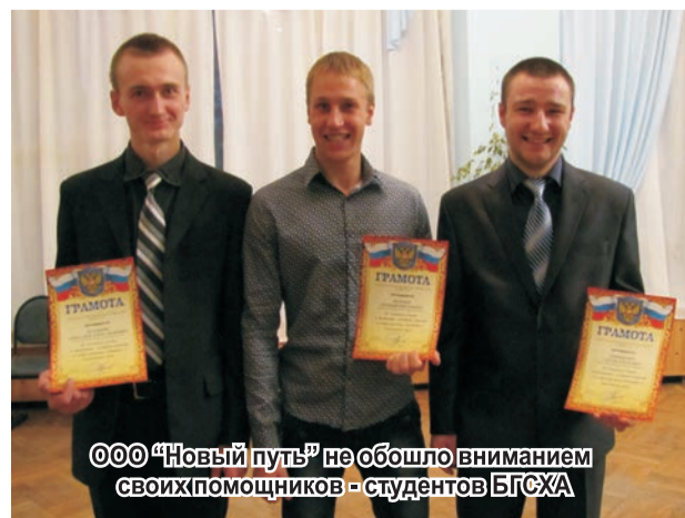
ООО «Новый путь» не обошло вниманием своих помощников - студентов БГСХА