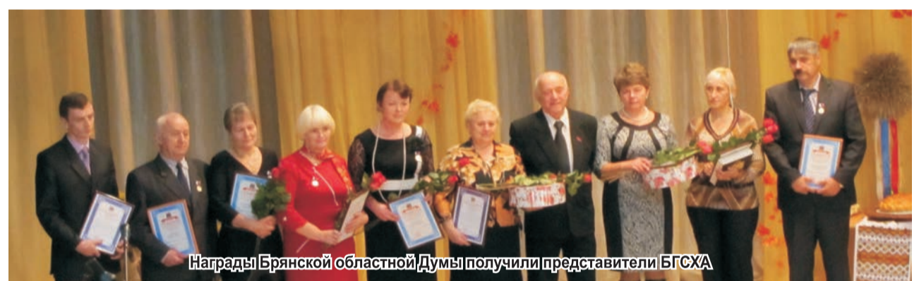
Награды Брянской областной Думы получили представители БГСХА

В Открытой международной студенческой Интернет-олимпиаде по экологии в Юго-Западном государственном университете была завоевана брон-