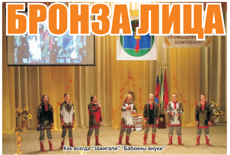
Как всегда «зажигали» «Бабкины внуки»

На текущий период 2013 года общий объём финансирования внешних научных исследований составляет около 6 млн. рублей (5 819 209 рублей).