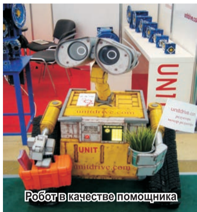
Робот в качестве помощника

Студенты с немалой заинтересованностью следили за каждым движением участников действия, удивлялись их сноровкой и мастерством. Этот своеобразный мастер-класс пошёл на пользу каждому, кто желает стать настоящим специалистом в своём деле. Посещение студентами подобных выставок имеет большое значение. Ведь подобного разнообразия техно-