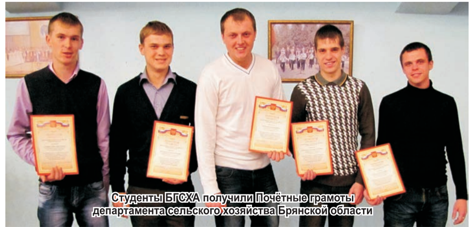
Студенты БГСХА получили Почётные грамоты департамента сельского хозяйства Брянской области