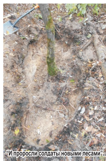
«И проросли солдаты новыми лесами»...

Найденные поисковиками академии погибшие бойцы, к сожалению,