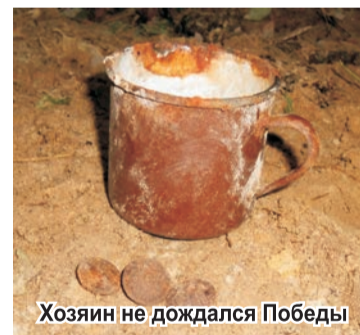
Хозяин не дождался Победы

нию, оказались безымянными. Вместе с ними были остатки неизрасходованных боеприпасов, сапёрные лопатки, кружка и ложка, складной нож, зеркальце, кошелёк с 10-копеечной монетой, остатки одежды и обуви, но не найдено ничего, что могло бы помочь установить их имена. Тем не менее, останки павших воинов-освободителей будут преданы земле на территории карачевского мемориала со всеми заслуженными почестями. Солдаты, пусть и спустя 70 лет, вернутся с войны: не без вести пропавшими, а героически погибшими во благо своей Родины.